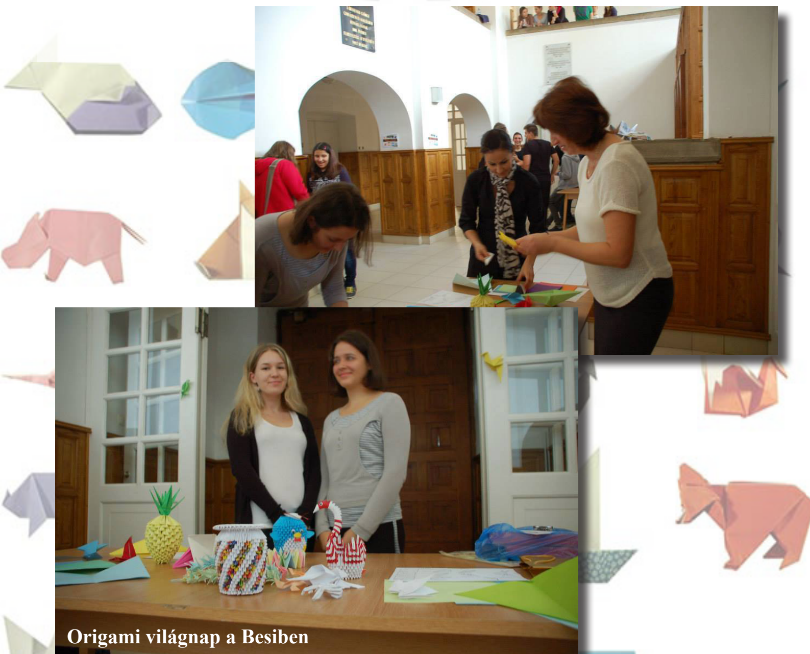
Origami világnap a Besiben